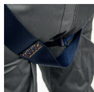
Correa bajo glúteos