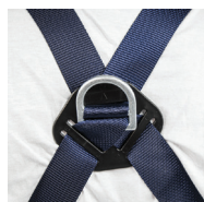
Anclaje dorsal formado por una D metálica

Garantía de 10 años a partir de la fecha de fabricación y de 5 años a partir de la fecha de puesta en servicio. El uso de EPI está sujeto a una formación obligatoria del usuario en un organismo certificado. Para garantizar la conformidad con la legislación y el uso de los equipos en perfecto estado, todos los E.P.I. anticaídas deben controlarse cada año y antes de cada uso debe realizarse una comprobación visual. Los equipos de protección personal UNYC@ están garantizados 10 años desde la fecha de fabricación y 5 años desde el primer uso.