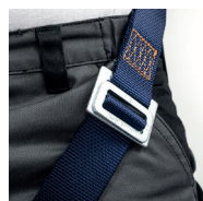
Hebillas de ajuste a la altura de los muslos